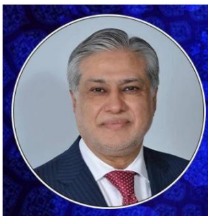
Ministre des Affaires étrangères du Pakistan