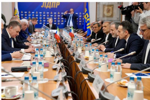
Araghchi rencontre des députés russes à la Douma