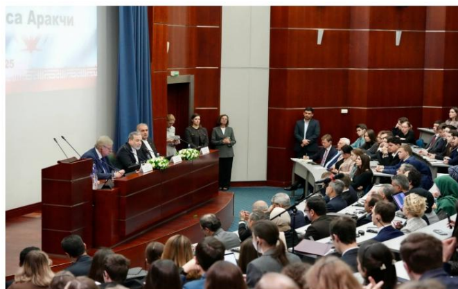
Discours d'Araghchi à l'Institut d'État des relations internationales de Moscou