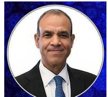
Ministre des Affaires étrangères égyptien