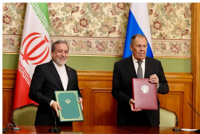
Araghchi signe un protocole d'accord avec Lavrov sur les consultations politiques