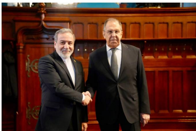
Araghchi rencontre le ministre russe des Affaires étrangères à Moscou.