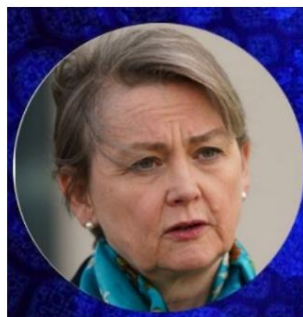
Ministre des Affaires étrangères du Royaume-Uni