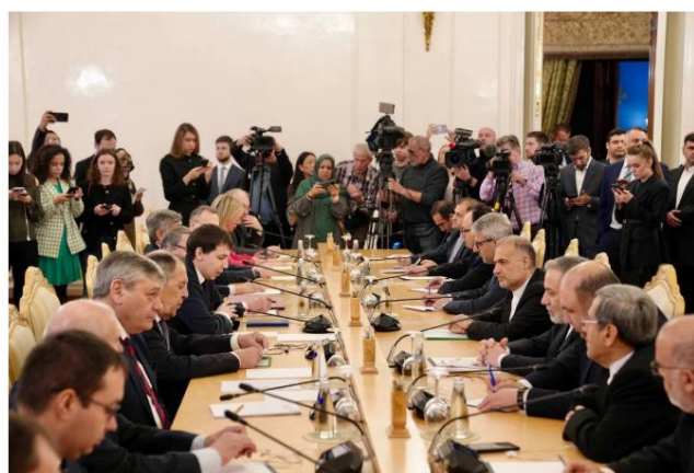
Réunion de consultations entre les délégations iranienne et russe