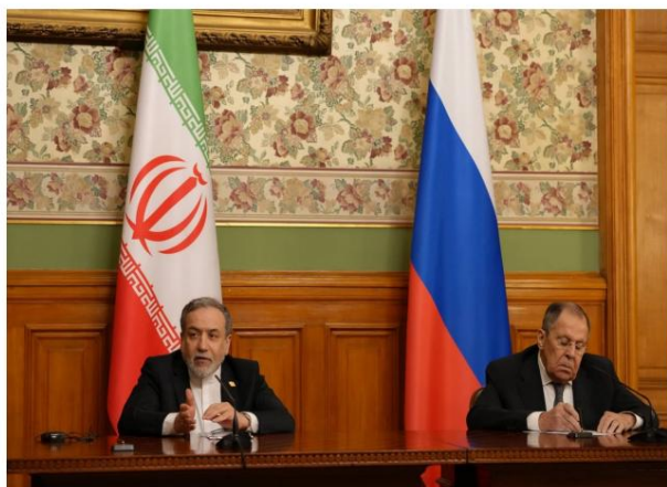
Araghchi, Lavrov tient une conférence de presse à Moscou